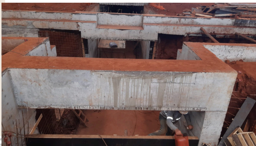
COMPATIBILIZAÇÃO e execução no projeto subterrâneo de um dos mais completos: Setor de reaproveitamento de areia de fundição.