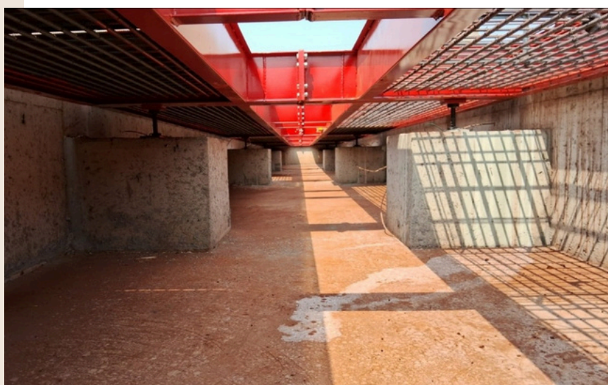
Balanças rodoviárias em geral.

Moega-pendurada em concreto armado no Brasil. (Fundição VV)