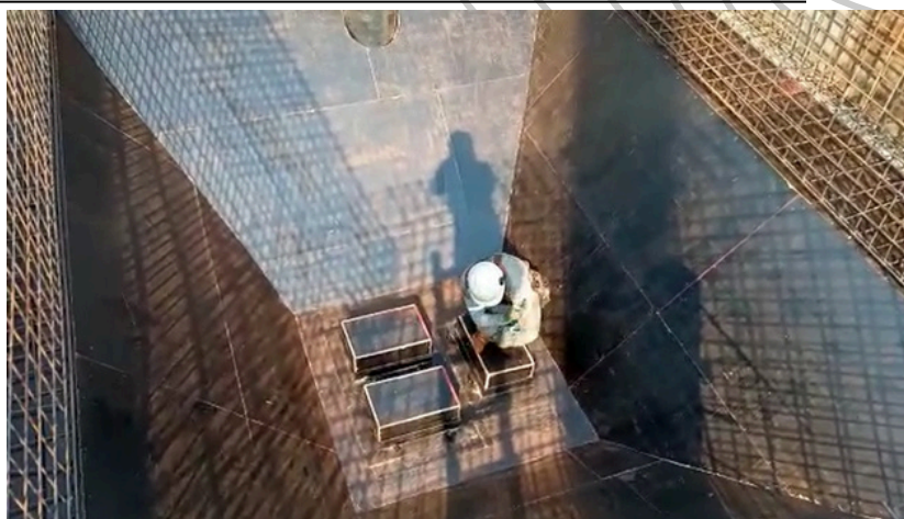
Execução completa na carpintaria da mais robusta

Empreitada parcial, total, mista, de mão de obra, por preço unitário ou por preço global.